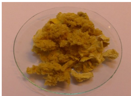
شکل ۴: رنگدانه خشک حاصل از قارچ اسپرژیلوس

امروزه مطالعات زیادی بر روی رنگدانه های میکروبی و کاربرد آنها در صنایع مختلف در حال انجام است. از طرف دیگر امروزه توجه قابل ملاحظه ای نیز به استفاده از منابع طبیعی در مواد غذایی، آرایشی و سایر صنایع شده است (۱ و ۵). زیرا بسیاری از رنگدانه های مصنوعی که به طور گسترده در مواد غذایی، لوازم آرایشی و بهداشتی و فرآیندهای تولید دارو استفاده می شوند خطرات زیادی را به دنبال دارند (۱۷). به منظور جداسازی پیگمان های میکروبی می توان از حلال آب و DMSO استفاده نمود. سد ماک (Sedmak) و همکاران در سال ۱۹۹۰ از حلال شیمیایی DMSO برای استخراج رنگدانه کارتنوئید استفاده کردند و از آن به بعد در تمام نقاط دنیا از این روش استفاده می گردد (۱۸). لایت (Light) و همکاران در سال ۱۹۶۸ از برخی از گونه های جلبک به عنوان مثال کلایدموناس ( chlamydomonas ) غلظت بالایی از رنگدانه قرمز آستاگزاتین را جداسازی کردند.