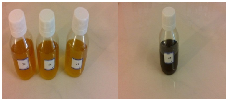
شکل ۳: پیگمان های مورد نظر برای اندازه گیری توانایی جذب اشعه UV (تعیین فاکتور SPF)

امروزه مطالعات زیادی بر روی رنگدانه های میکروبی و کاربرد آنها در صنایع مختلف در حال انجام است. از طرف دیگر امروزه توجه قابل ملاحظه ای نیز به استفاده از منابع طبیعی در مواد غذایی، آرایشی و سایر صنایع شده است (۱ و ۵). زیرا بسیاری از رنگدانه های مصنوعی که به طور گسترده در مواد غذایی، لوازم آرایشی و بهداشتی و فرآیندهای تولید دارو استفاده می شوند خطرات زیادی را به دنبال دارند (۱۷). به منظور جداسازی پیگمان های میکروبی می توان از حلال آب و DMSO استفاده نمود. سد ماک (Sedmak) و همکاران در سال ۱۹۹۰ از حلال شیمیایی DMSO برای استخراج رنگدانه کارتنوئید استفاده کردند و از آن به بعد در تمام نقاط دنیا از این روش استفاده می گردد (۱۸). لایت (Light) و همکاران در سال ۱۹۶۸ از برخی از گونه های جلبک به عنوان مثال کلایدموناس ( chlamydomonas ) غلظت بالایی از رنگدانه قرمز آستاگزاتین را جداسازی کردند.