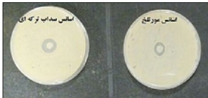
شکل ۱: قطر هاله عدم رشد شیگلا دیسانتریه پس از تأثیر اسانس دو گیاه مورتلخ و سداب ترکه ای

با توجه به صفر بودن قطر هاله عدم رشد در تیمار شاهد، از جدول تجزیه واریانس و مقایسه میانگین حذف گردید. نتایج نشان داد که بین دو گیاه در سطح ۵ درصد و بین غلظت های