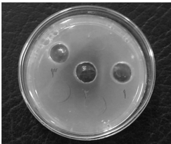
شکل ۲: ژل ایمونودیفیوژن: حفره (۱) نمونه تست، حفره (۲) آنتی بادی پلی کلونال ضد Vi، حفره (۳) آب مقطر.

کلنی های باکتری سالمونلا تایفی احیا شده در روی محیط سالمونلا-شیگلا آگار بی رنگ بود و در مرکز کلنی ها نقطه سیاه رنگی دیده شد. در محیط بلاد آگار کلنی ها مرطوب و دارای ۲-۳ میلی متر قطر بودند. همچنین در EMB و مک کانکی، کلنی های شفاف و بی رنگ مشاهده شدند. باکتری در زیر میکروسکوپ نوری بصورت باسیل های گرم منفی تک دیده شد. با انجام رنگ آمیزی کپسول، وجود کپسول به صورت هاله شفاف در اطراف باکتری و بنفش رنگ در یک زمینه تیره مورد تأیید قرار گرفت. همچنین ویژگی های بیوشیمیایی باکتری کشت داده شده نیز مطابق با جداول تعیین هویت کتاب برگی بود.