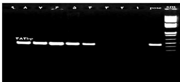
شکل ۳: الکتروفورز حاصل از PCR ژن aac(6)-Ib-cr در باکتری اشریشیا کلی. (SM) مارکر ۱۰۰ جفت بازی، (Pose) کنترل مثبت، ستون های ۴ تا ۸) قطعه تکثیر یافته با طول ۴۸۲ جفت باز.

سلیسیوس به مدت ۴۵ ثانیه و در نهایت گسترش نهایی در دمای ۷۲ درجه سلیسیوس به مدت ۷ دقیقه انجام شد. محصولات PCR پس از الکتروفورز بر روی ژل آگارز ۱ درصد با استفاده از دستگاه ترانس لومیناتور مورد بررسی قرار گرفتند. (و) آنالیز آماری: در این مطالعه از آمار توصیفی استفاده شد و برای نشان دادن فراوانی ژن های مورد مطالعه و مقاومت آنتی بیوتیکی از نمودار هیستوگرام استفاده گردید.